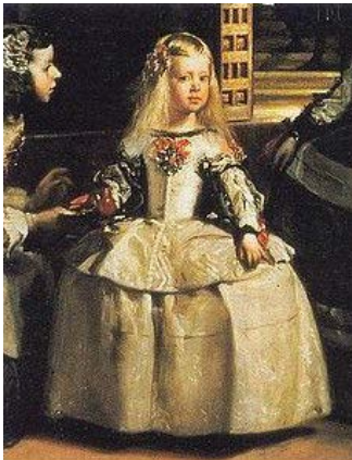
fig.1 - Detalhe da obra de Diego Velázquez